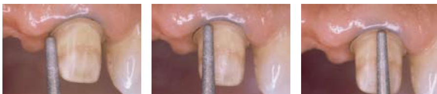
バーを歯軸に平行にして研削するだけで遊離エナメルや凹凸の無い均一なショルダーマージンが得られる