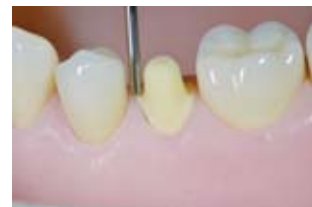
マージン部の修正

CAD/CAM技術を応用した修復物は、一般的にセラミックブロックなどから削り出される。形成は機械のインストルメントや、歯質と修復物への抵抗形態を意識して成されなければならない。主な修復物の装着には、接着材が使用される。SN/バーセットは、以上を考慮し構成してある。