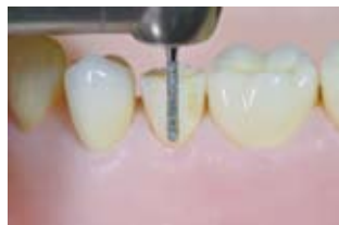
1mmのガイドグループ形成

C-30f, C-30ff, D-31Rf, D-31Rff, K-33f, K-33ff 各 ¥2,250 Endcutting 1.2 ¥3,000